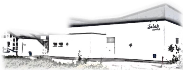
Selah Center, Klokkestøbervej 1A, 8800 Viborg +45 86600233