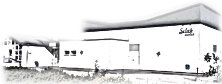
Selah Center, Klokkestøbervej 1A, 8800 Viborg +45 86600233